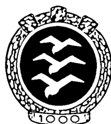
2.2.3 Abzeichen für 1000 km und mehr (die Abbildung zeigt das 1000 km-Abzeichen. Andere, auch mit weniger Diamanten, sind ähnlich).