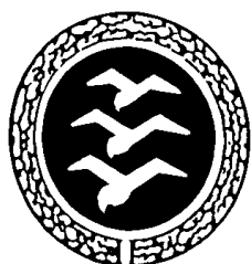
2.2.1 Abzeichen in Silber und Gold