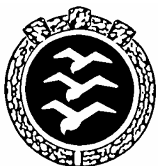
2.2.2 Abzeichen mit drei Diamanten (1 und 2 Diamanten ähnlich)